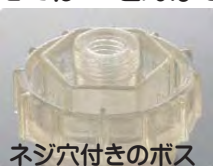
ネジ穴付きのボス