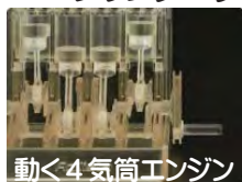
動く4気筒エンジン