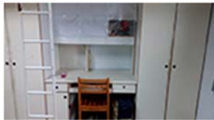
下段が机とロッカー、上段がベット