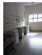
洗濯機・乾燥機完備