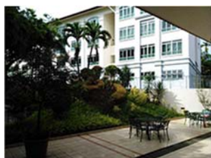
ホステル外観 (警備員駐在・IDカードで管理)

滞在方法 : ホステル Nanyang Girl's Boarding School 1部屋 2~3人 (ホステルからシンガポールポリテクニクまでは路線バスで通学)