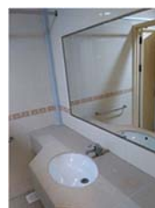
各部屋にトイレ、シャワー、洗面台あり