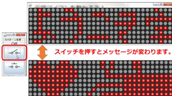
パソコン上でプログラムを編集し 表示パターンを作成